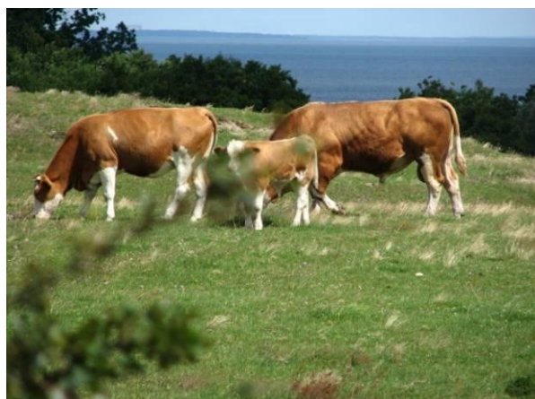
Betesdrift på Lindgrens backar; den viktigaste naturvårdaren även framöver.