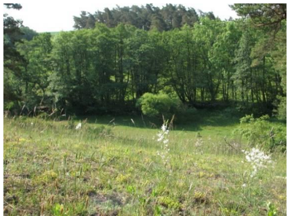
Klammersbäcks dalgång; bevara de unika kvaliteter som finns i området.