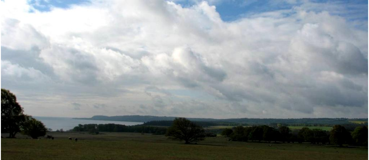
Haväng.....sedan flera tusen år ett arkadiskt landskap.

Remissvar avseende reviderat förslag, 2012-07-19, till ”Förslag till skötselplan för det planerade naturreservatet Haväng och Vitemölla strandbackar i Simrishamns kommun” , inklusive bilagor.