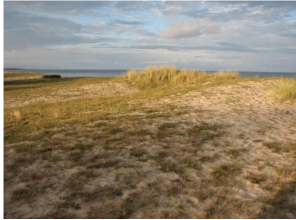
Sandflykt söder om Verkeåns mynning; försiktighet nödvändig för att undvika ytterligare sandförflyttning.