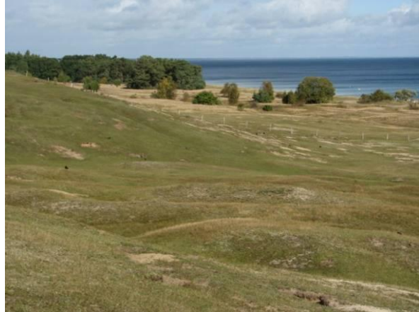
Obetat och betad slänt vid Vitemölla strandbackar; bättre utnyttja områdets möjligheter.